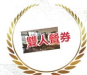
星級飯店自助餐 雙人餐券

※主辦單位保留調整及終止本活動權利，活動內容若有異動，將於活動官網公告，恕不另行通知