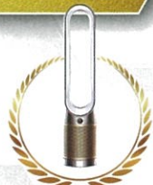
Dyson二合一 甲醛偵測空氣清淨機

活動官網： https://www.sfi.org.tw 服務專線：(02)2397-1222 分機338周小姐、335王先生 E-mail： haoyu@sfi.org.tw