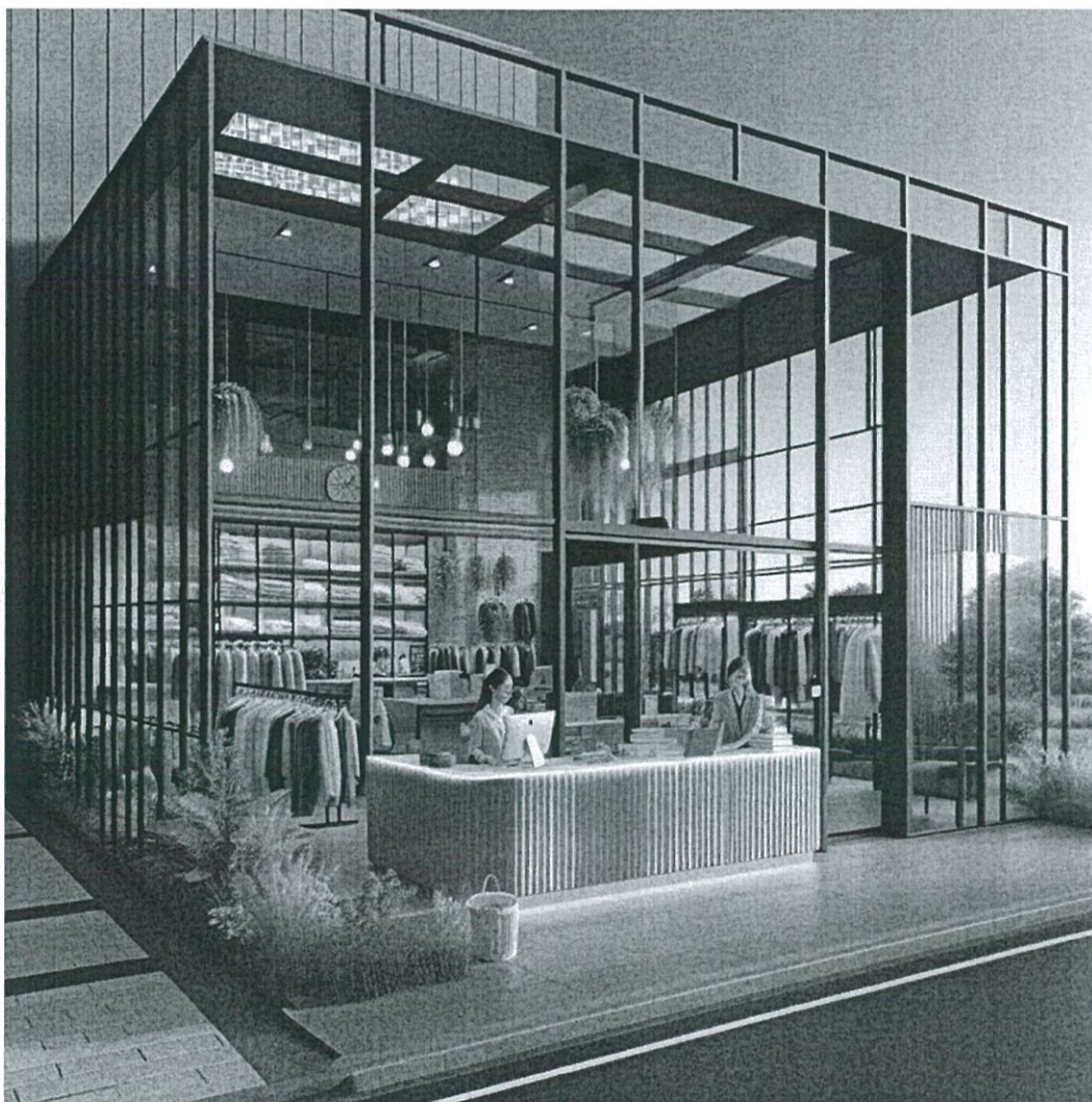
作品名稱 - 智慧織品的未來工廠